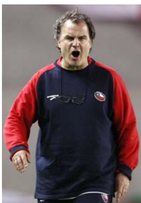
Den tidligere chilenske landstræner og nuværende Athletic Bilbao-træner, Marcelo Bielsa.

Fascinerende var det aggressive, høje presspil, som Chile praktiserede. Kompromisløst hele kampen igennem og med et fysiologisk krav fra Bielsa om, at spillerne skulle kunne udføre det i samtlige 90 minutter. Det fortalte han i hvert fald på et pressemøde i Brøndby efter kampen mod Danmark, hvor han blandt andet viste en øvelse, hvor to spillere havde bolden mod en forsvarer. Området var relativt stort (frimærket), og når de to med bolden spillede bande og søgte fremad i banen, så skulle angriberen nå hen og bryde bolden eller i det mindste tackle den ud over sidelinjen. En øvelse, der var blevet takseret til moderne slaveri, hvis du havde bedt danske spillere udføre den, så krævende er den både fysisk og mentalt.